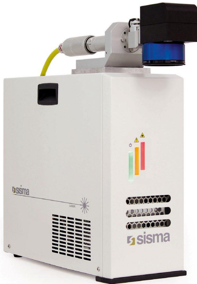
Laser marking system Laserbeschriftungssystem